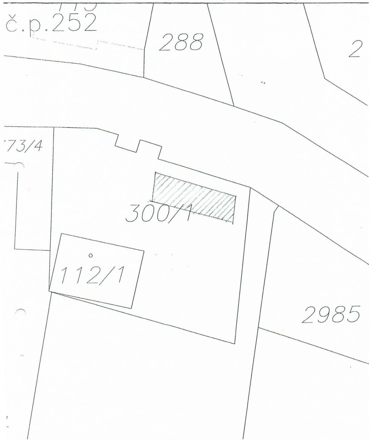
Tržní místo - prostor před budovou hasičské zbrojnice ve Vidči