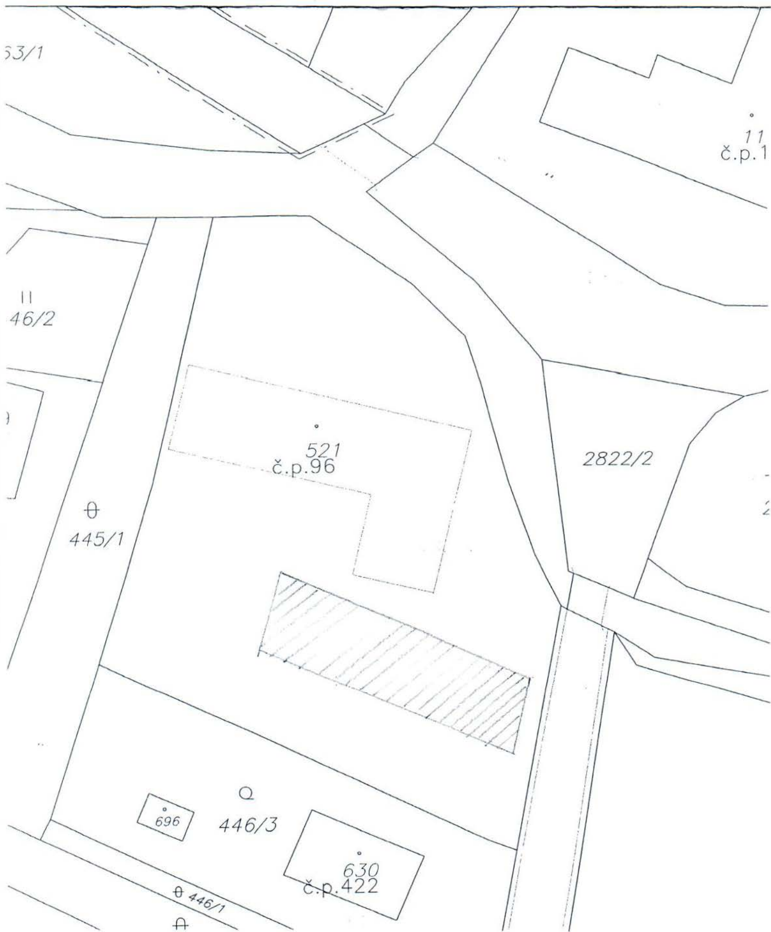
Tržní místo - prostor před budovou Obecního úřadu ve Vidči