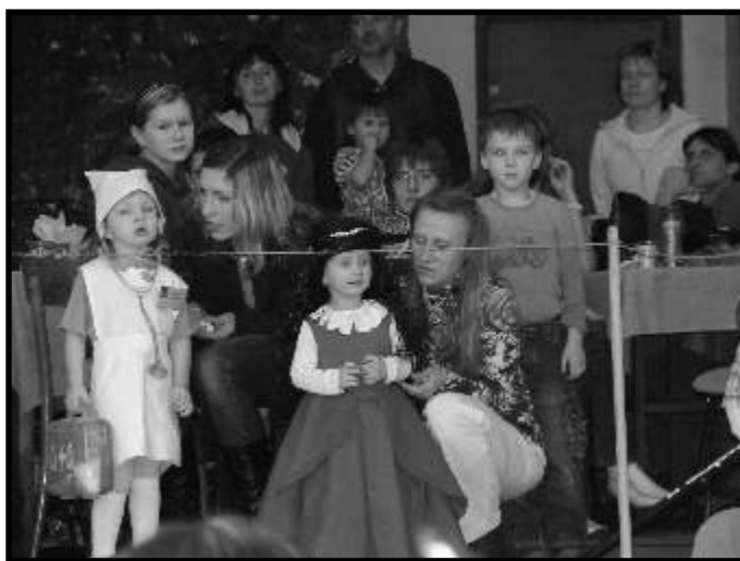
Nejlepší masky byly odměněny darečkem