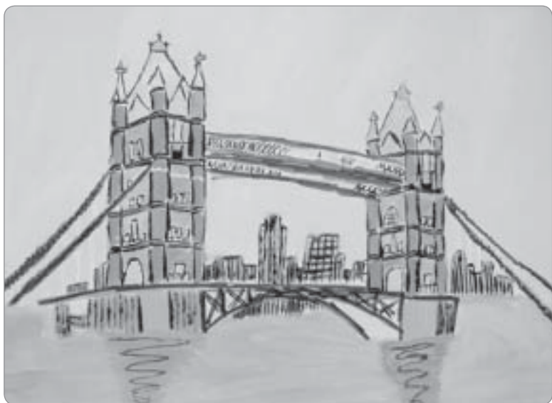
Impozantní zvedací most Tower Bridge na řece Temži v Londýně.