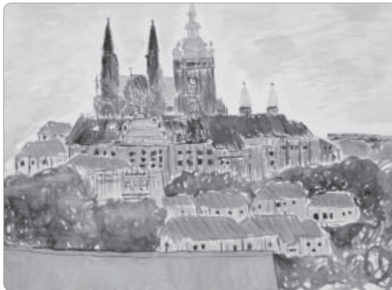
Pražský hrad je významnou českou národní kulturní památkou.