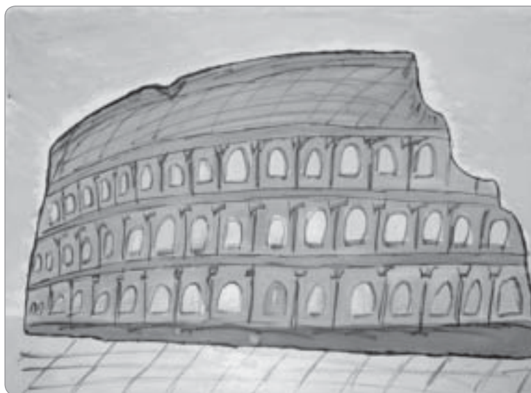
Koloseum patří k předním pamětihodnostem římské architektury.