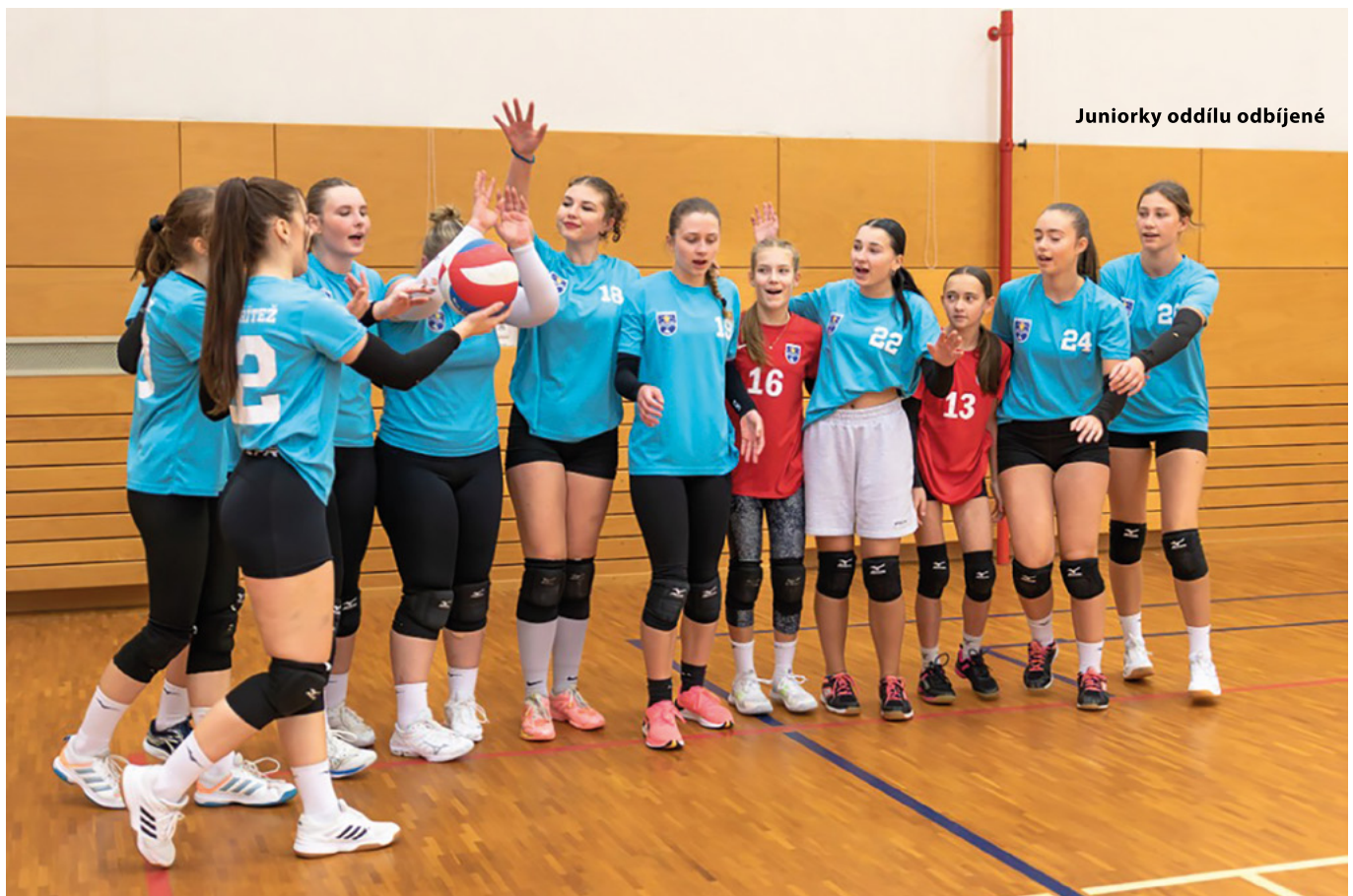
Juniorky oddílu odbíjené