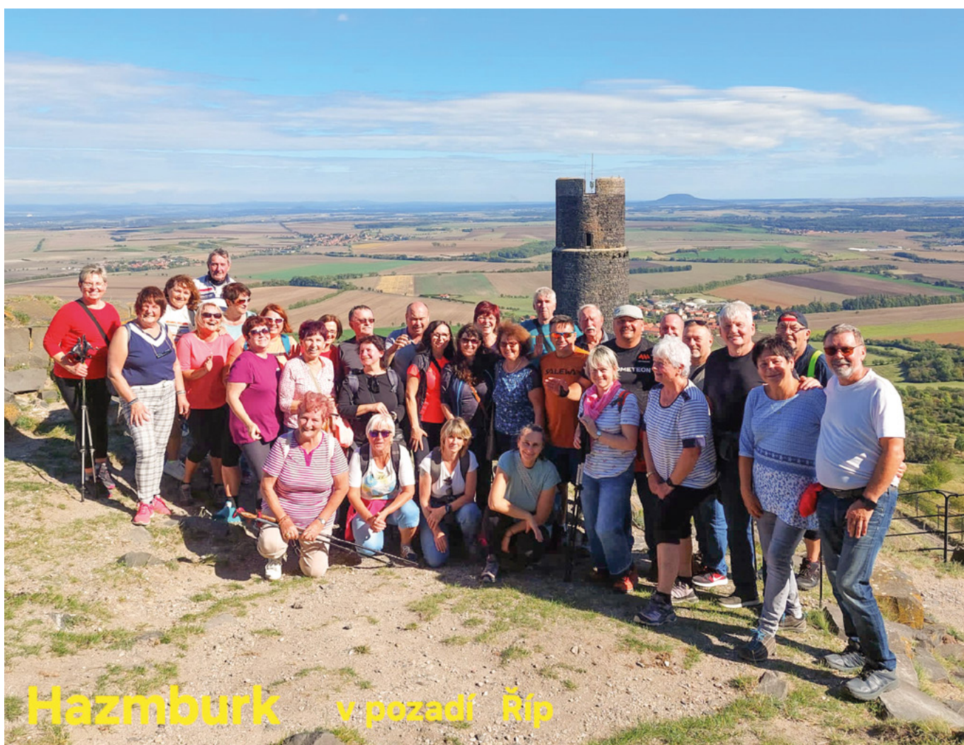
Hazmburk v pozadí Říp