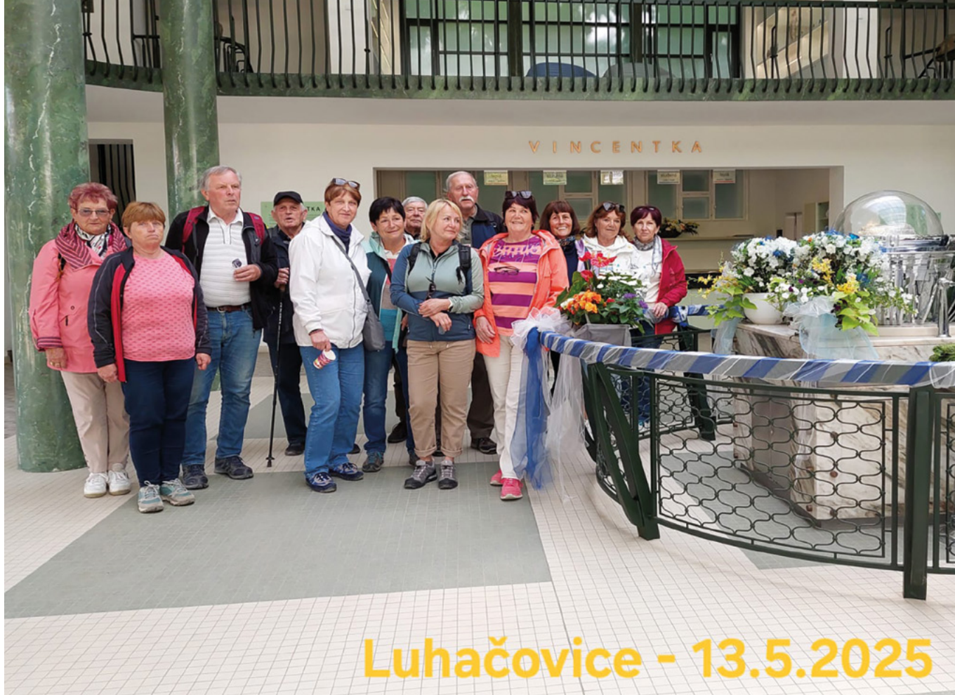
Luhačovice - 13.5.2025