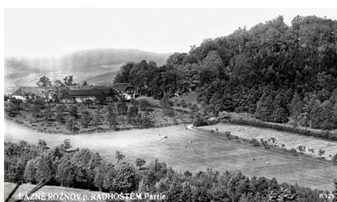
LAZNE ROZNOV P. RADHOŠTĚM, Páříte

Statek Hradisko měl na dvoře dvě hluboké roubené studny, dnes jsou obě zasypané. Uprostřed nádvoří stála kašna.