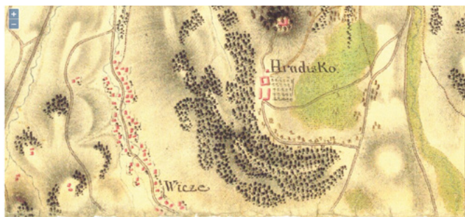
Mapa I. vojenského (josefínského) mapování z poloviny 18. století

Určitě jste také slyšeli zkazky o dolování v oblasti Hradiska v 17. století, kdy se v jeho jihozápadní části začal těžit vápenc pro výrobu vápna. V následujícím století se těžařské aktivity rozšířily i na nedaleký Svatoněk, kde byla zahájena těžba železné rudy. Ta se následně zpracovávala v hamrech u Zubří v letech 1712-1755 ( hamry byly vodou poháněné kovárně). Éra místního hornictví však netrvala dlouho – kvůli nízké výtěžnosti ložisek se od těžby brzy upustilo. Tehdejší majitel panství tak chtěl zřejmě zvednout hodnotu panství resp. hradu.