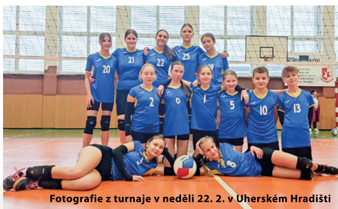
Fotografie z turnaje v neděli 22. 2. v Uherském Hradišti

Mladší žactvo – V sezóně 2025/26 hraje v krajské soutěži celkem 12. družstev, které jsou rozděleny do tří skupin. V této soutěži jsme jediné vesnické družstvo. Naším dětem se už několikrát podařilo vyhrát svou skupinu a tím postou-