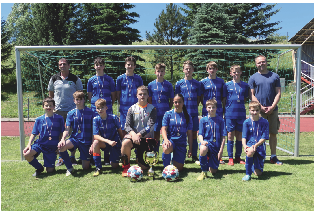
Starší žáci 2. místo Okresní pohár 2024