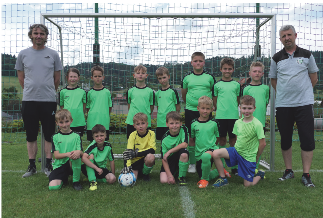
Mladší příprava TJ Vidče