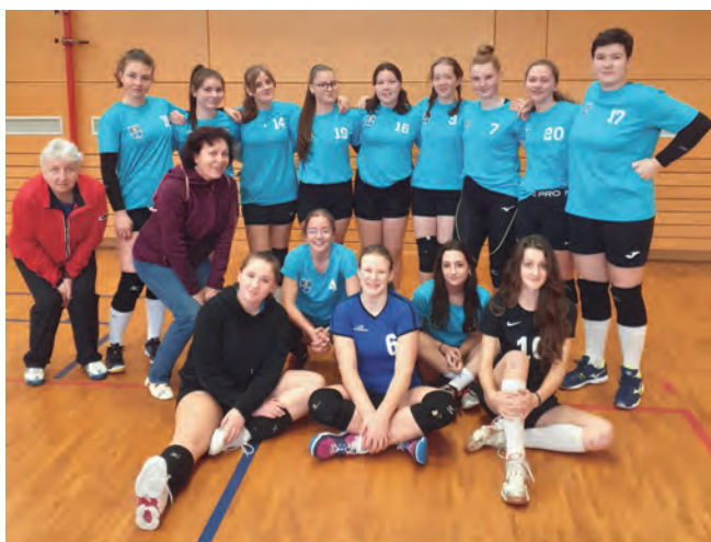
Družstvo kadetek po zápase s Kroměříží.