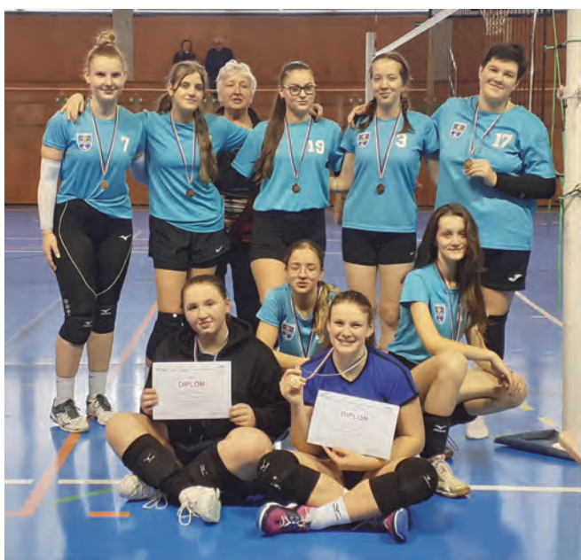
Družstvo kadetek s diplomy a medailemi za třetí místo v krajském přeboru kadetek a pohárové soutěži

Junioři hráli poslední zápas krajského přeboru doma v pátek 24. 3. s družstvem Starého Města. Hráčům se sice nepodařilo proti druhému družstvu v tabulce zopakovat podzimní výsledek, kdy jsme Staré Město na jejich hřišti jednou porazili, ale i tak naši hráči podali proti soupeřům - starším o 3 až 4 roky - velmi bojovný výkon. Po odehrání celé soutěže sice skončili v závěru tabulky, ale s několika vyhranými zápasy na kontě. O jejich zlepšení svědčí i to, že některé zápasy prohráli velmi těsně 2:3, kdy zvítězila, jen větší herní zkušenost soupeřů v koncovce. Vzhledem k tomu, že tato kategorie se hraje do 21 let, mají naši ještě velmi mladí hráči, vše před sebou.