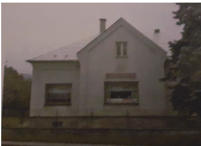
Budova bývalé fary slouží dnes coby prodejna potravin.