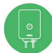
PLYNOVÝ KONDEZAČNÍ KOTEL*