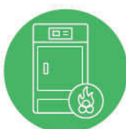
KOTEL NA BIOMASU