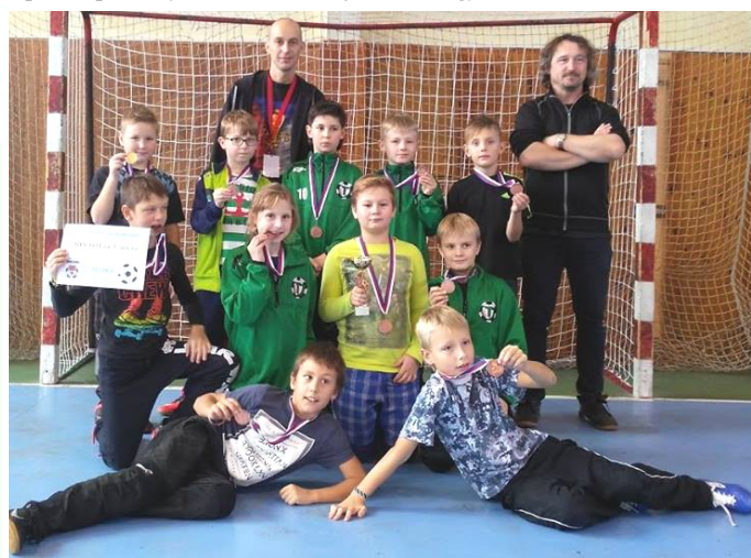
Starší přípravek třetí na turnaji v Rožnově pod Radhoštěm