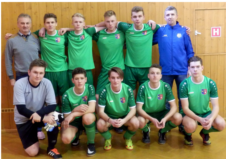
Družstvo dorostu, vítěz halového turnaje v Bystřici pod Hostýnem

Nejmenší mladší přípravek hned první neděli v roce 2018 odehrála turnaj v hale na Koryčanských pasekách v Rožnově p. R., zde z osmi týmů obsadila 6. MÍSTO. Zahrála si tréninkové utkání v tělocvičně ZŠ Valašská Bystřice a má v plánu absolvovat dva halové turnaje v měsíci březen.