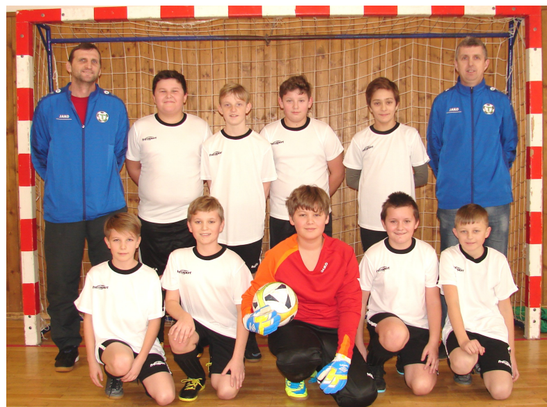
Mladší žáci postoupili do finálového turnaje Zimní ligy VLADIMÍRA ŠTĚPÁNA.