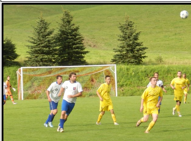
Foto z fotbalového utkání mužů