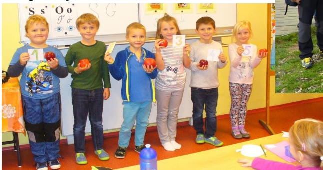
Čtvrtek 20. října byl pro prvňáčky neobyčejný.