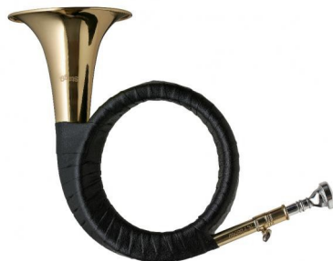
Borlice (B lesovka)