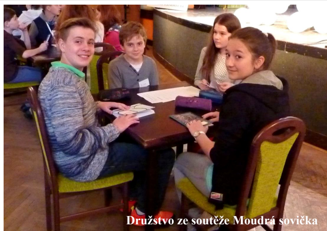
Družstvo ze soutěže Moudrá sovička

19. 4. jelí do Rožnova také šestáci a deváťáci na přednášku o Peru, která jim přiblížila daleké kraje.