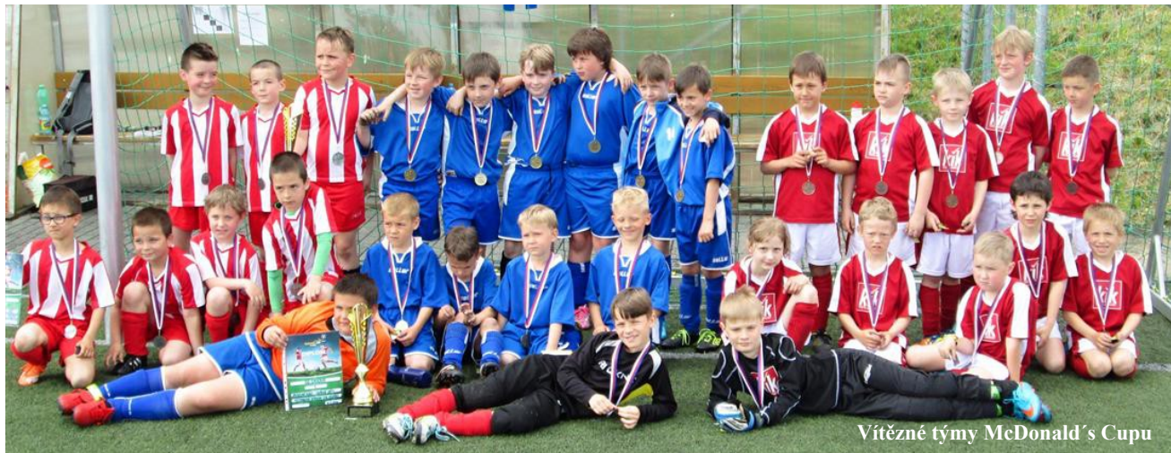
Vítězné týmy McDonald's Cupu