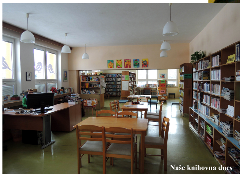
Naše knihovna dnes

Můžete si také prohlédnout výstavu prací dětí mateřské školy s jarní tematikou nebo obrovské sršní hnízdo, které najdete v knihovně jako připomínku na Den Země 2016. Těšíme se a čekáme na vás do pátku 17. června 2016 , pak zavřeme a uvidíme se až na podzim.