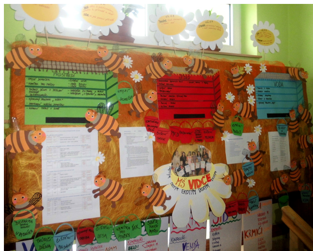
Cíle projektu Ekoškola na rok 2016