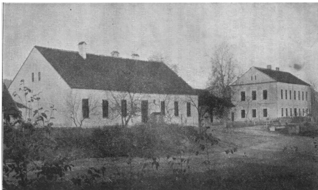
Fojtství vlevo (dnes hospoda u „Hanáčků“ a původní budova škola vpravo.

Zásadou je vždy postavit chrám na vyvýšeném místě. Původní záměr byl postavit chrám na fojtově louce, aby kostel se školou a fojtstvím vytvořil jakési náměstí ve středu obce. Viz ilustrační obrázek.