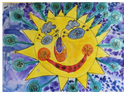
SLUNÍČKO LETNÍ, JARNÍ, PODZIMNÍ, ZIMNÍ