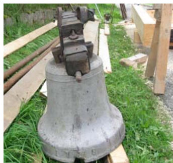
Zvon v roce 2009 při opravě zvoničky.