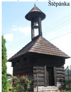
Zvonička po opravě.