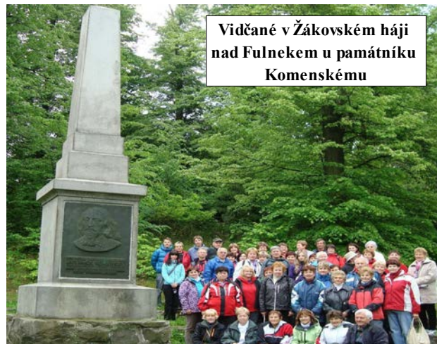
Vidčaně v Žákovském háji nad Fulnekem u památníku Komenskému