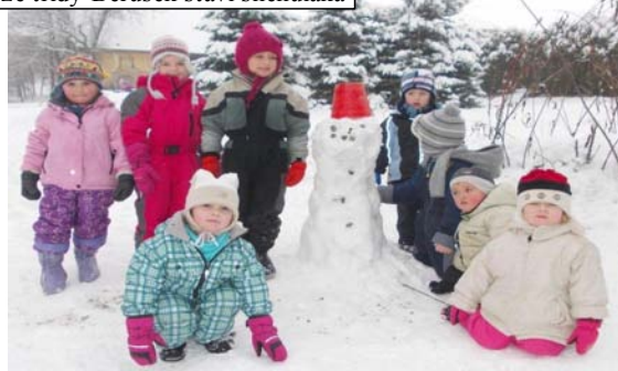
Děti ze třídy Berušek staví sněhuláka

všichni příbuzní. Svým vystoupením děti dokazují, že dospěly do věku, kdy by měly opustit brány MŠ a otevřít si cestu dál, učit se a poznávat, že životní cesta není jednoduchá a k cíli se musí dorazit přes různé překážky,“ uzavírá ředitelka MŠ.