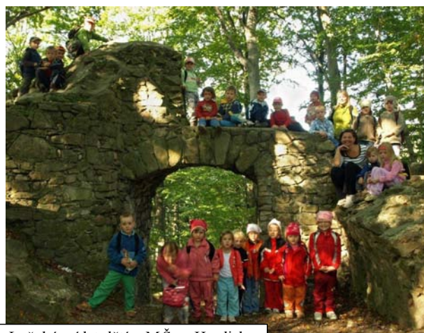
Loňský výlet dětí z MŠ na Hradisko

Od podzimu do léta je program mateřinky plně nabitý. Děti tvoří podzimníčky, s lucerničkami se vydávají na pochod brouček, připravují se na nejrůznější besídky a vystoupení. Často a rády soutěží, už mnohokrát si přivezly cenná vítězství i zkušenosti. Velká sláva se koná v červnu. „ Žáci deváté třídy předávají štafetu našim předškolákům, aby měli dobrý start do nového života. Na obci je dětem předán pamětní list s medailí a odpoledne ukončujeme velkou slávu Zahradní slavností, kde jsou přítomni