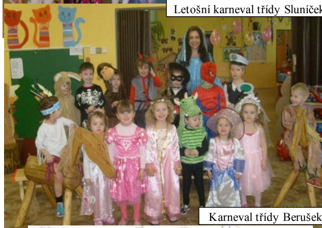
Karneval třídy Berušek