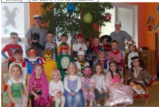
Letošní karneval třídy Sluníček