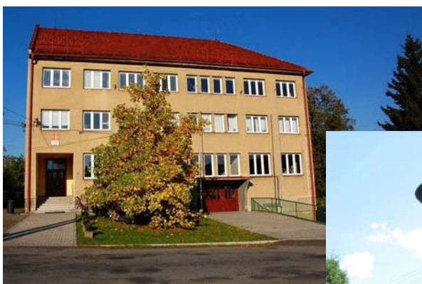
Kulturní dům po rekonstrukci