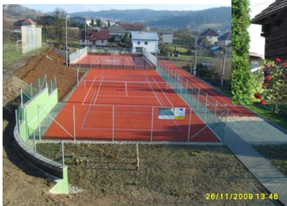
Nové víceúčelové hřiště a hřiště pro nejmenší děti