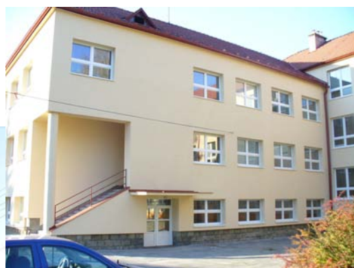
Základní škola s novou fasádou