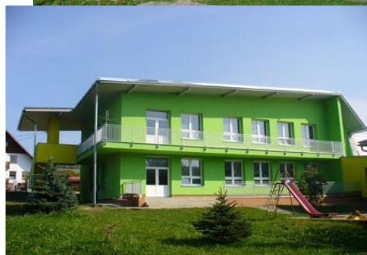
Zrekonstruovaná knihovna a mateřská škola