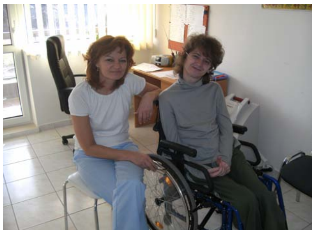
Ondra na kyslíkoterapii