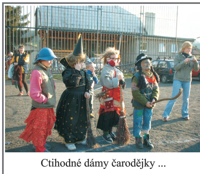
Ctihodné dámy čarodějky ...