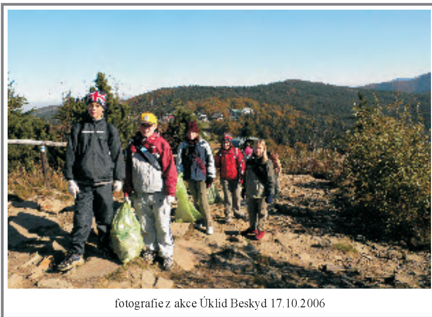
fotografie z akce Úklid Beskyd 17.10.2006

pro všechny návštěvníky naučné stezky Lysá hora. Pokud soutěžící zašlou do konce června na adresu Správy CHKO Beskydy (Nádražní 36 Rožnov p.R. 756 61, nebo beskydy@nature.cz ) vyluštěnou tajenku z letáčku (přůvodce) po naučné stezce Lysá hora, zašleme mu zajímavé tiskoviny o přírodě a krajině Beskyd. Zmíněný letáček je dostupný na informačních centrech (především v obcích pod Lysou horou) a na Správě CHKOB v Rožnově.