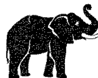
Lenka Machulová, 7. Třída

Do Hranic jsme přijeli ve 21 h , kde na nás čekali rodiče s auty. Celý den na exkurzi nás doprovázela naše milá tř. učitelka Vladka Mertová a ochotná maminka Lenka Machulová. Tento výlet se nám moc líbil a doufám, že příště pojedeme na další exkurzi.